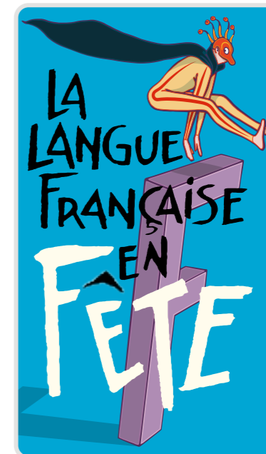
Le logo évènementiel La langue française en fête

« Si des évènements ou campagnes d'information sont organisés par des partenaires (opérateurs), asbl ou tout autre type d'associations, soutenus par les moyens financiers de la Fédération Wallonie-Bruxelles, ils doivent apposer le logo institutionnel sur tous les supports de communication » (charte graphique institutionnelle FW-B, p 22).